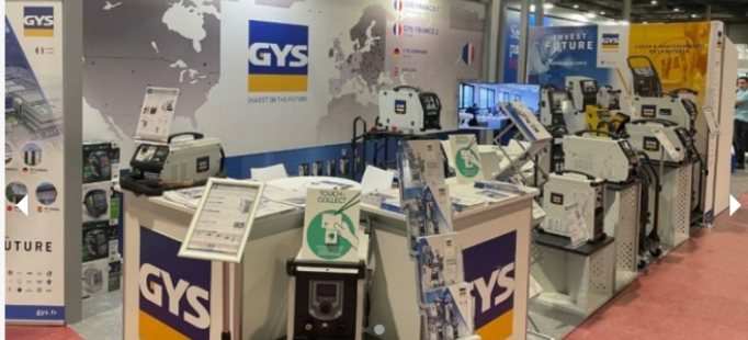
GYS presentará sus novedades Mig/Mag en la feria Unire